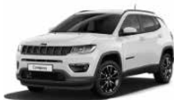
Jeep Compass 28.900 €

Il vantaggio che si trasforma in maggior valore del tuo usato