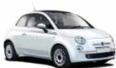
FIAT 500 15.000 €

Il vantaggio che si traduce in minori costi d'acquisto